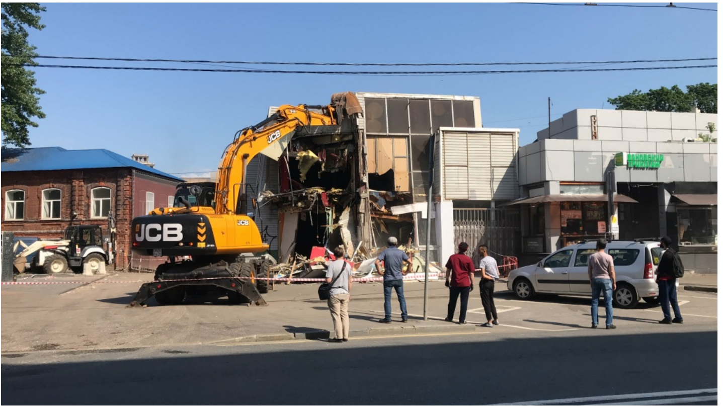
Фото после демонтажа