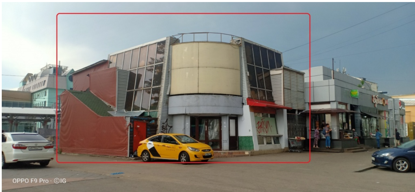
Фото в работе