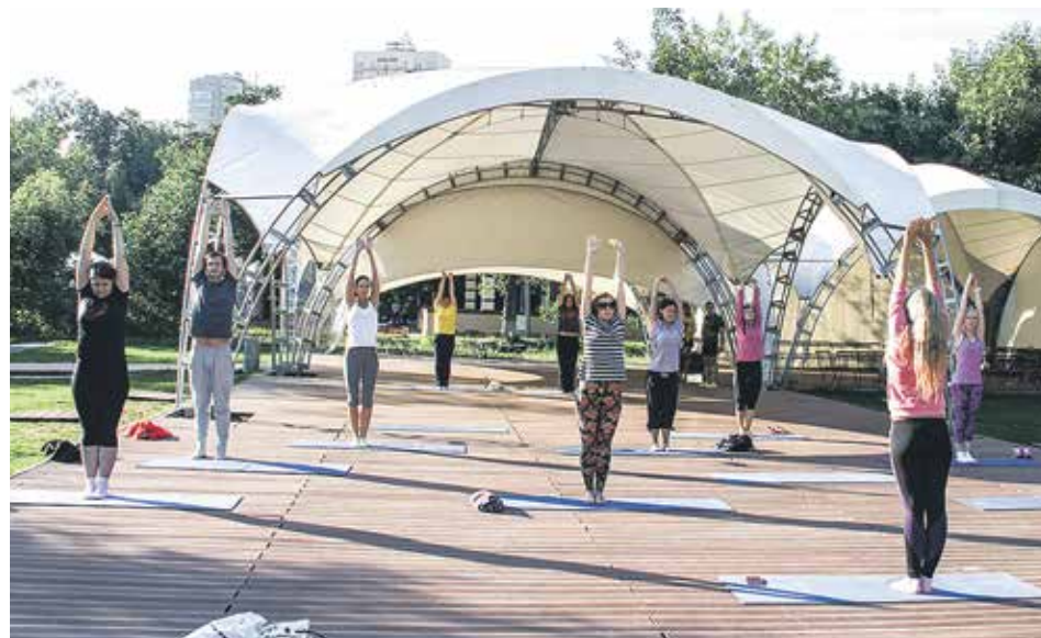
Разминка на свежем воздухе

Клуб «50 Плюс», пер. Красина, д. 15, к. 1, тел. +7 (495) 787-67-62, www.50plus.ru