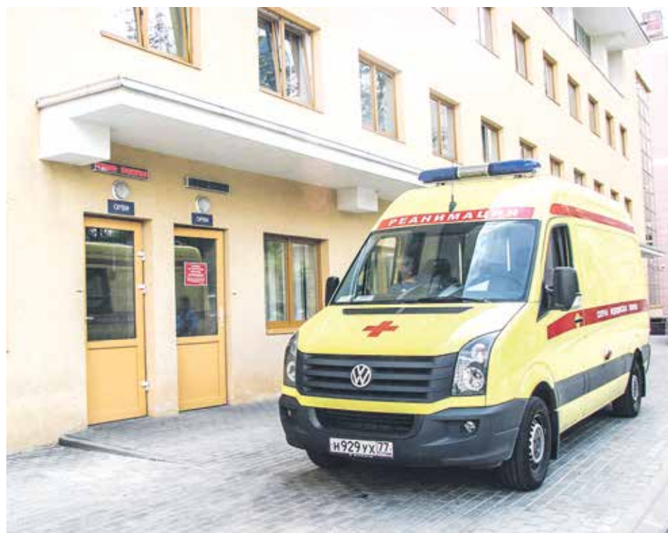
Дежурный автомобиль реанимации у входа в отделение больницы

— Из оборудования, которое следовало бы отметить, у нас есть два компьютерных томографа, один ядерно-магнитный резонансный томограф. В настоящее время ведутся работы по подготовке помещения для размещения у нас второго ядерно-магнитного резонансного томографа, который, как и новейший рентгеновский аппарат,