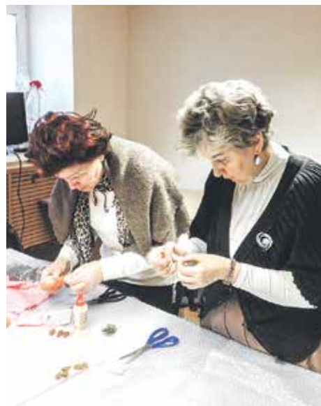
Мастерицы за работой

На самом деле войлоковаление — техника древняя. Известна легенда о том, что первый войлочный ковер появился в Ноевом ковчеге. Животных там, как известно, было много, шерсть с них летела комьями, падала, смешивалась с потом и плотно утрамбовывалась копытами... Так и появилось на земле первое войлочное изделие.