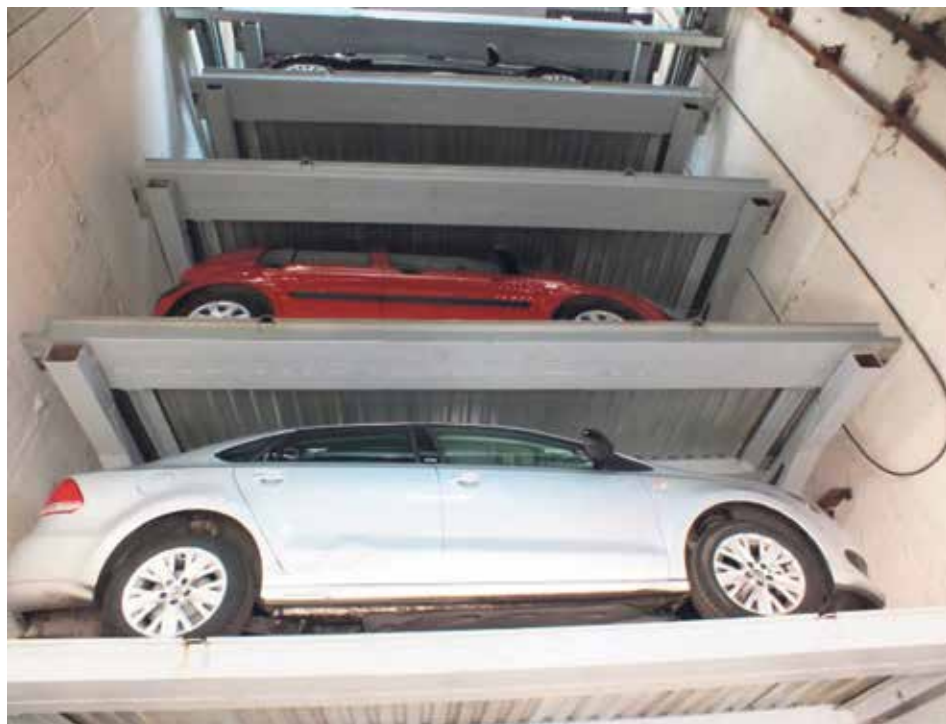
представляет собой подземный одно-уровневый гаражный комплекс на 53 машино-места, встроенный в жилой дом.

В настоящее время эксплуатирующей организацией завершены мероприятия по ремонту автоматики управления. Обновленный механизированный паркинг открыт для горожан. Стоимость услуг паркования в данном объекте составляет 5000 рублей в месяц за одно машино-место. На сегодняшний день свободные места составляют 30%. Помимо механизированной парковки на Климашкина в Центральном округе восстановлен также подземный паркинг в Большом Саввинском переулке, д. 3, в районе Хамовники. Объект, который в течение пяти лет находился в неудовлетворительном состоянии,