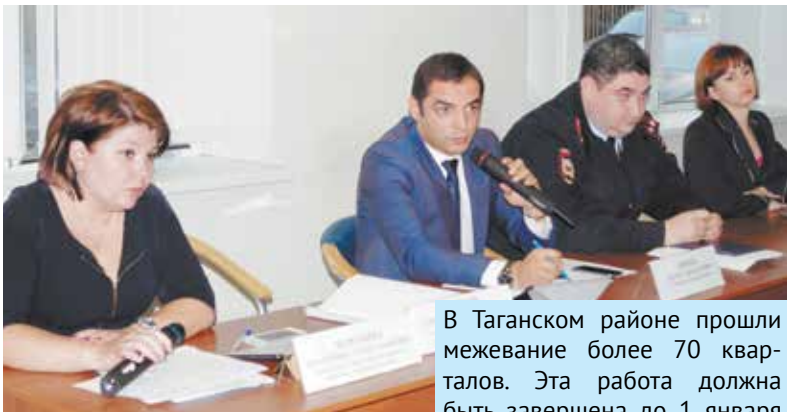
В Таганском районе прошли межевание более 70 кварталов. Эта работа должна быть завершена до 1 января 2015 года.

Для чего вообще нужно знать границы квартала и возможные варианты использования земли? Прежде всего для того, чтобы оградить свой двор от нежелательного строительства или откровенного захвата территории под парковки или коммерческую деятельность. Но неопределенность границ приводит к спорам и конфликтам. Поэтому мэр Сергей Собянин и правительство Москвы поставили задачу как можно быстрее завершить работу по межеванию. Квартальное межевание делается за счет средств городского бюджета. Заказчиком и разработчиком проектов выступает Департамент городского имущества, а управы осуществляют только координацию процесса.