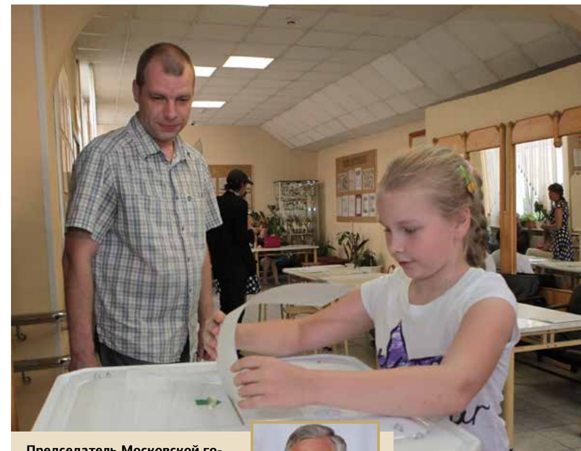
Председатель Московской городской избирательной комиссии Валентин Горбунов: «Подход к рассмотрению документов, представленных разными кандидатами, должен быть единообразным. Необходимо максимально добросовестно и конструктивно выстроить отношения со всеми кандидатами».

Завершилась регистрация кандидатов в депутаты Московской городской думы. Удостоверение кандидатов получили 273 человека. Из них 224 человека выдвинуты политическими партиями, еще 49 зарегистрированных кандидатов – самовыдвиженцы. Всего заявляли о выдвижении 467 человек. Отказано в регистрации 15 кандидатам (из них 12 самовыдвиженцев).